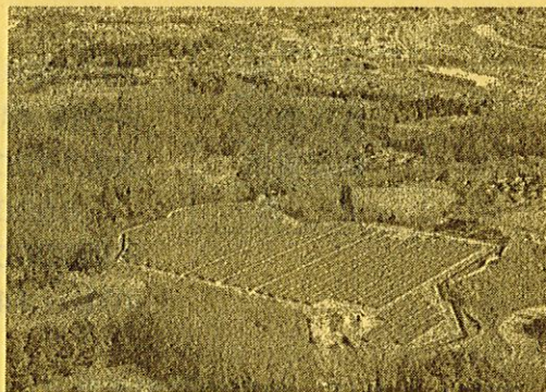
4704枚のパネルを敷きつめた「メガソーラーいいだ」

地域産業の工場見学では「シチズン平和時計」を訪ねました。この会社のスローガンは精密企業ならではの「もっと小さく・もっと輝く」でした。社内マイスターと呼ばれる熟練技能士(ほとんどが女性)による手での組立作業のすごさにも驚きました。